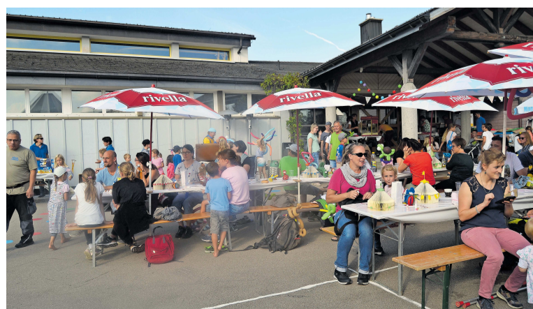
Chilbigäste in Hemberg vergnügen sich in der Festwirtschaft.

Hemberg Die Vereine in Hemberg luden zur Sommer-Chilbi und die Besucherinnen und Besucher kamen zahlreich. Die Gäste konnten sich an verschiedenen Spielen messen, sich beim Fallbrett der Mojuga duellieren und sich auf der Hüpfburg oder dem Karussell amüsieren. Anklang fanden auch das Ponyreiten und der Ballonkünstler Clown Manu. Am Abend stand die Kinder- und Jugend-Disco auf dem Programm, wo ebenso ausgelassen gefeiert wurde. (pd)